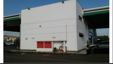
croqui - 1518003355136.jpg